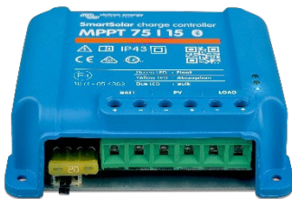
Controlador de carga SmartSolar MPPT 75/15