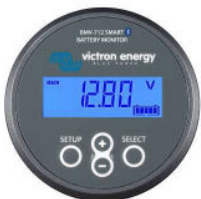
Detección de Bluetooth BMV-712 Smart Battery Monitor