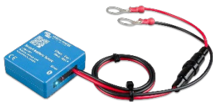
Detección de Bluetooth Smart Battery Sense